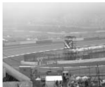
▲霧でコース上、ほとんど視界ゼロ

先日の9月28〜30日、富士スピードウェイにて30年ぶりに開催された、F1日本グランプリへ土曜日の予選のみ行ってきました。なぜ土曜だけかというと、皆さんもニュースなどでご存知だと思いますが、帰りのバスを道路が陥没したとの理由で、雨が降る寒空のなか4時間も待つという悲惨な状態になってしまいました。それ