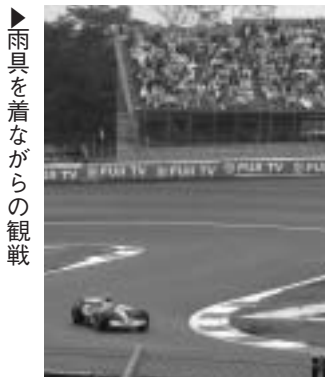
▶雨具を着ながらの観戦

先日の9月28〜30日、富士スピードウェイにて30年ぶりに開催された、F1日本グランプリへ土曜日の予選のみ行ってきました。なぜ土曜だけかというと、皆さんもニュースなどでご存知だと思いますが、帰りのバスを道路が陥没したとの理由で、雨が降る寒空のなか4時間も待つという悲惨な状態になってしまいました。それ