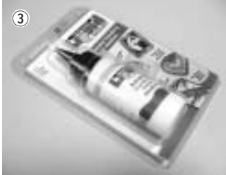
② (写真) 指先である程度形を作ってから、ヘラを使って形を出していきます。スカルピ同士をくっつける時使うのが、リキッドスカルピです。(写真③)「くっつくと

年賀状に写っているトリッキーくん(今思いついて勝手につけた名前)はスカルピ(「ここ」ではプリモスカルピを使用)とい