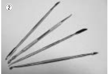
③ (写真) 指先である程度形を作ってから、ヘラを使って形を出していきます。スカルピ同士をくっつける時使うのが、リキッドスカルピです。(写真③)「くっつくと

きオススメです。」とかなかどこかに書いてあったので使いました。そして焼きます。そうです。オーブンでチンツです。(しつこい)焼いた後はデザインナイフで削ったり、紙ヤスリやスポンジヤスリを使って修正して、「いよいよ」と思ったら完全に焼き上げます。次はいよいよ色ぬり。エアブラシを使います。焼き上がったキャラクターにサーフェイサー(下地ぬり)をほどこし(写真④)、マスキングしながら順番に色をぬって