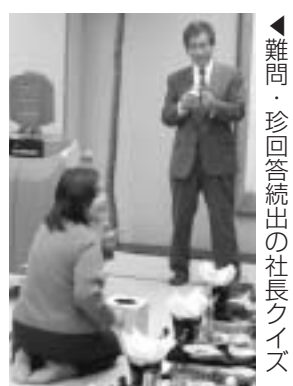
▲難問・珍回答続出の社長クイズ

石を散りばめたような100万ドルの夜景を同時に堪能できます。熱海城では全面芝生の岬庭園でお花見ができコーヒー&レストランの営業、焼き鳥・おでん・飲み物の出店などが並びにぎわいます。 ● 四月四日(月) 沼津市 大瀬まつり・内浦漁港祭 ● 四月九日(土) 三島市 鎮花祭 …桜はもちろん、様々な草木が一斉に芽をかく四月上旬は、古来疫病が流行する季節といわれます。「鎮花祭」は三嶋大社で行われる病氣や災難よけを祈念するお祭りで、三日と五日に行われる稚児行列、健康祈願祭のあと、四月九日に行われます。