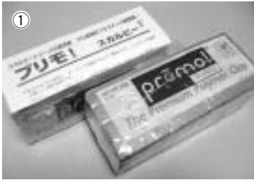
① (写真) プリモという素材