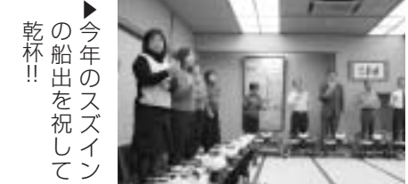
▲今年のスズインの船出を祝して乾杯!!