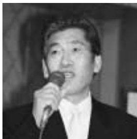
スピーチする社長、中西部長